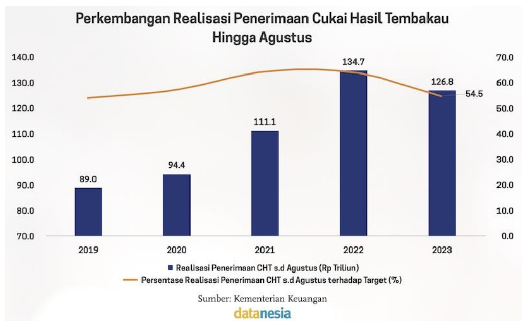
Gambar 1.1 Realisasi penerimaan cukai

Berikut adalah grafik realisasi penerimaan cukai hasil tembakau di Indonesia tahun 2019-2023.