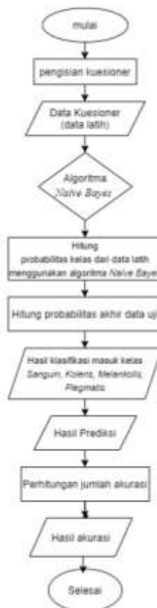
Gambar 2 Flowchart Klasifikasi menggunakan Naïve Bayes