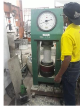
Gambar 4. Uji desak