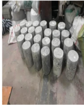
Gambar 3. Benda uji