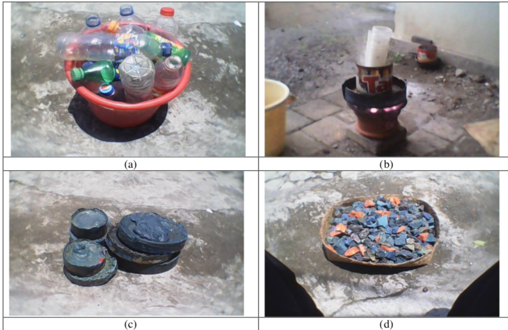
Gambar 1. Pengolahan limbah plastik menjadi agregat kasar; (a) Botol plastik bekas, (b) Proses Pemanasan, (c) Plastik yang telah didinginkan dan (d) Plastik yang telah dipecah menyerupai agregat kasar.