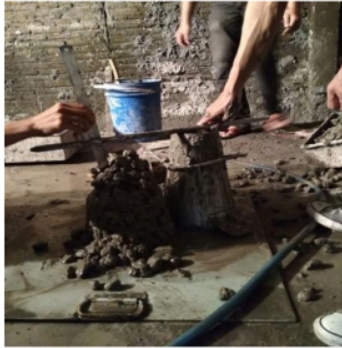
Gambar 2. Uji slump

Setelah beton berumur 14 dan 28 hari maka dilakukan pengujian kuat tekan dan modulus elastis beton dengan tujuan mengetahui seberapa besar kuat tekan dan modulus elastis dengan jalan memberikan beban kepada benda uji sampai hancur (Gambar 4).