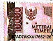
Adila Usli Silastuti